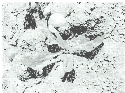
atac de pureci

Adultii hibernanti apar primavara la sfarsitul lunii martie, inceputul luni aprilie cand in sol la 5 cm adancime se mentine timp de mai multe zile o temperatura constanta de 5°C. Dupa aparitie adultii incep sa se hraneasca pe diferite specii spontane dupa care trec in culturile de sfecla abia rasarite, unde isi continua hranirea. Acestia ataca frunzele de regula pe partea inferioara, unde produc mici orificii sub forma de ciuruire. Uneori rod si petiolul.